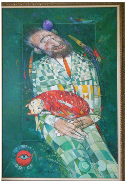
Imagen 1: El Gran Abuelo

tan bien retratado por Pedro Pablo Oliva en sus cuadros 11 .