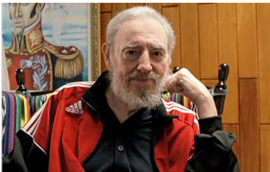
Imagen 2: La actual imagen de Fidel Castro en la prensa